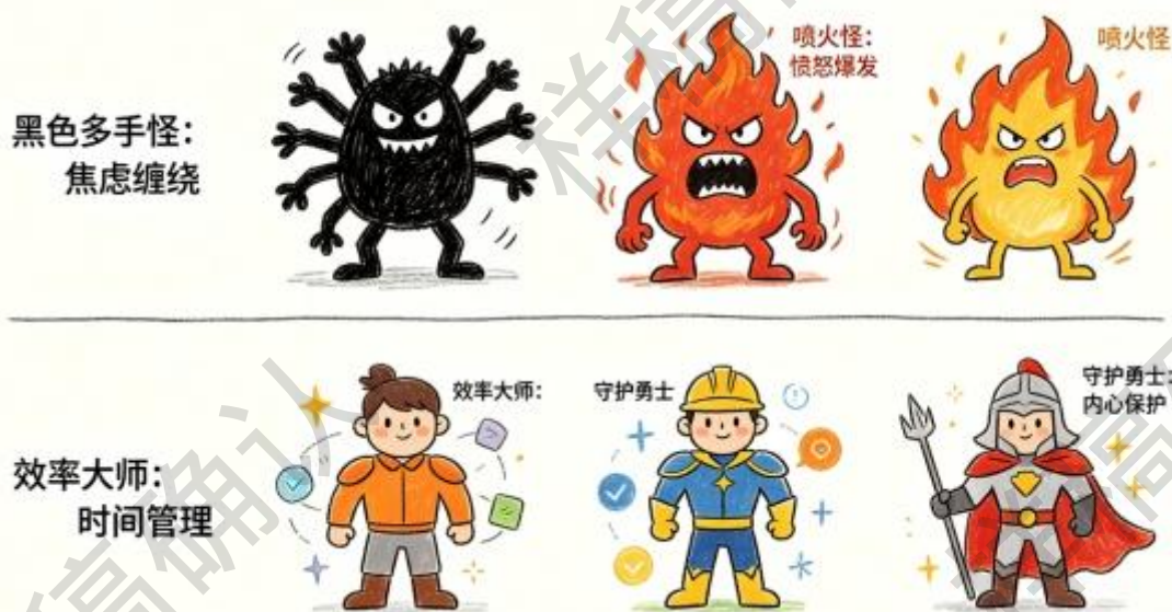
图 2 “我的情绪怪物”作品改造前后对比（作者自制）