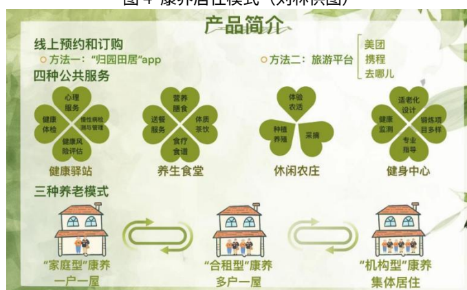
图5 “归园田居”乡村康养模式