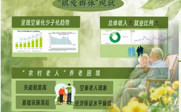
图 1 “银发群体”现状

现今养老服务供给有着显著失衡，就算 2023 年各类养老服务机构跟设施达到 40.4 万个，床位超出 517 万张，可这些床位利用率只有 42% [5] 这一矛盾说明传统机构养老模式和老年人多样化需求之间存在错配，为养老模式创新赋予了发展空间 [6-1] 。