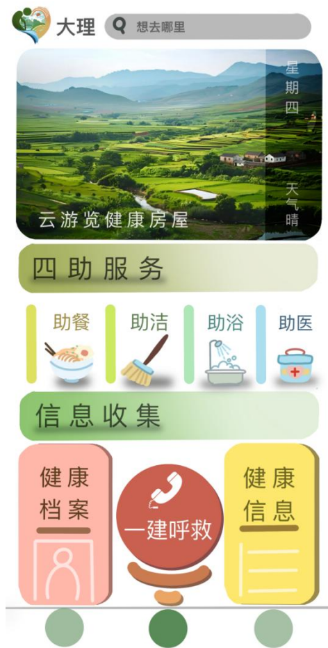
图 3 “归园田居” 小程序页面

如今我国养老服务体系存在供给结构单一与需求多元的突出矛盾，难以适配不同老年群体在经济实力、健康情形和生活偏好等方面的差别需求 [14-2] ，处理这个问题方面，“归园田居”康养模式凭借创新构建了三级差异化居住模式。按照农村闲置房屋的面积、区位以及设施条件，灵活采用不同居住类型，使分散的农村资源实现充分最大化利用 [7-5] ，该体系囊括家庭型、合租型与机构型这三种居住形态，家庭型模式针对高净值的老年群体开展，赋予独栋农宅的居住体验，配置