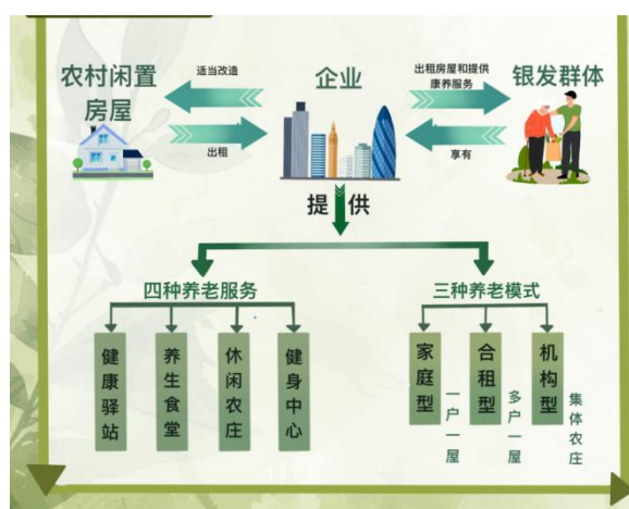
图4 康养居住模式

就服务配套层面而言,该模式把闲置校舍、村委会等公共建筑重新打造为四大公共服务模块,这是基于这些设施坐落于乡村中心区位,方便老人在近处去用;该建筑结构规整,空间十分敞阔,适合改造成公共服务的场地;况且既有的水电、卫生等基础设施相对良好,能极大降低改造的花费。依照老人的养老需求,把这些闲置房屋改建成“健康驿站”,配置基础的诊疗设备,给出健康监测与慢病管理相关服务;“养生食堂”把本地农产品加以利用,由营养师设计契合老人的食谱;“休闲农庄”把闲置农田划分成一个共享菜园,供老人投入到种植管理里;“健身中心”配置针对老人的器材,开设像太极拳这样的团体课程 [3-4] ,经过改造达成了资源盘活与服务提升的双重成效。