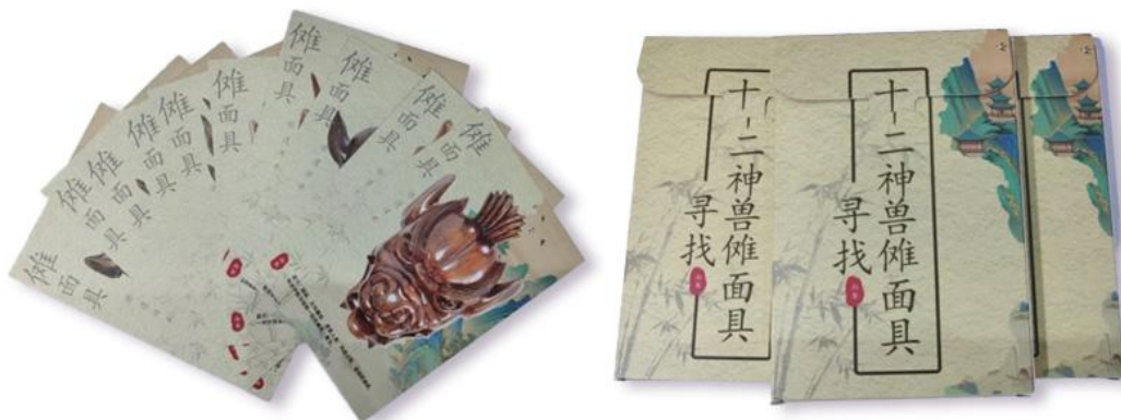
图2 《寻找十二神兽傩面具》文创

萍乡湘东区《寻找十二神兽傩面具》AR项目展现了分布式叙事机制的实践价值。该项目以经过考证的“十二神兽傩面具”为叙事基核,确保文化真实性;通过AR寻宝游戏构建叙事骨架,设计线索与动线却不限定探索路径;将古宅、祠堂等社区空间作为叙事肌体,村民的日常劳作与技艺展示为文化注入生命力;最终游客通过自主探索完成个性化的叙事编织,形成独特的情感联结。