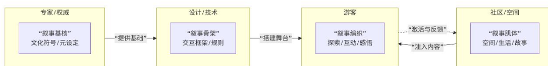
图1 交互机制图片分配模型

在分布式叙事机制中，游客承担着叙事参与者与共同创造者的双重角色。其行为特征表现为通过自主探索路径、选择性关注与实时社交互动，在预设的叙事框架内激活并重组由社区提供的文化内容，从而构建个性化的叙事序列。这种基于个体选择的动态叙事建构过程，实现了游客从被动接收信息到主动参与创作的认知转变，构成了叙事机制闭环的关键环节 [10] 。