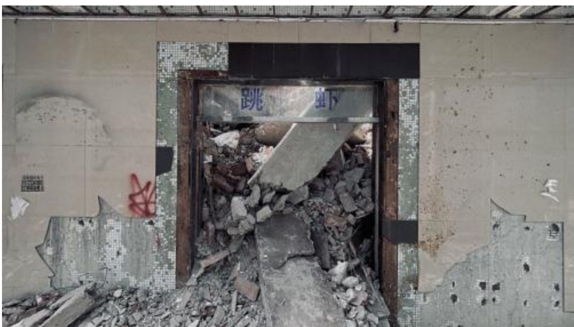
图 7 沿街店铺，可以看出没有被去除的招牌和文字，2025 拍摄于武汉

正是通过将些象征着秩序与理性规划的几何框架，与内部堆积如山、形态各异的瓦砾、碎石和裸露的钢筋并置，成功地在视觉上构建了一种强烈的矛盾与张力。这种构图策略使得观者在面对画面时，首先感受到的是一种曾经的秩序感，继而通过框架的引导，深入审视其内部所呈现的无序状态。这种“规整框架下的混乱内部”的视觉表达，直接且有力地呈现了“由整体向混乱演变”的过程，它不仅仅是对废弃建筑现状的记录，更是通过视觉语言，将“熵增”这一物理定律在城市语境下的表现力推向极致。