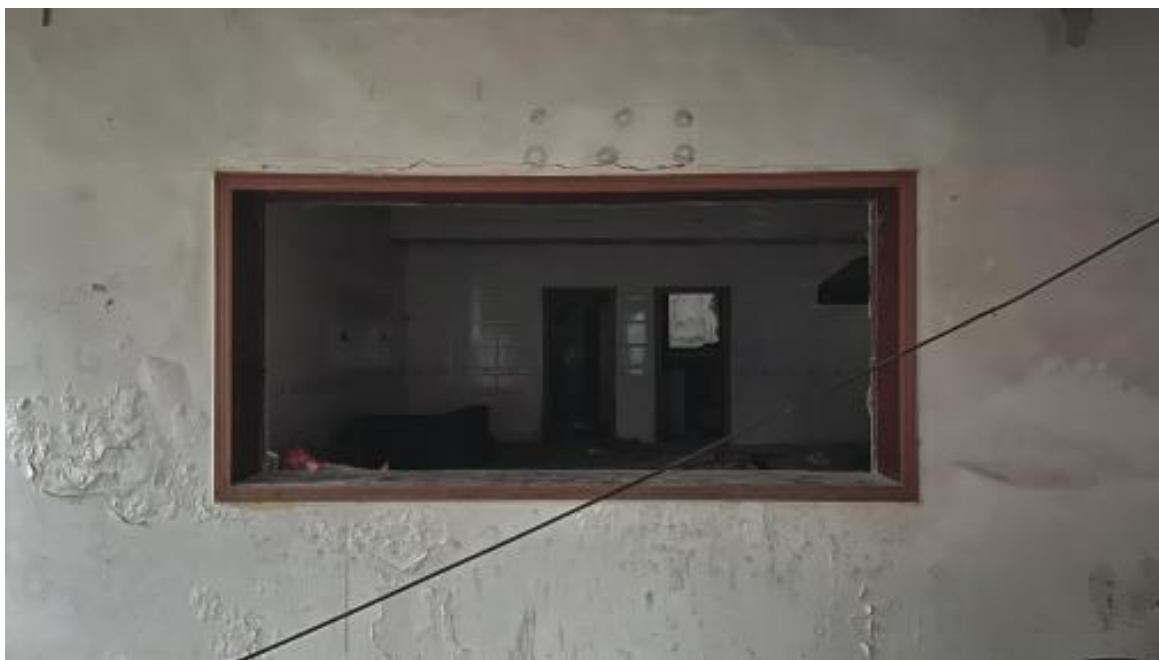
图4 废墟内部，矩形的门窗外框与门框内部杂乱的砖块和生活痕迹，2025 拍摄于武汉