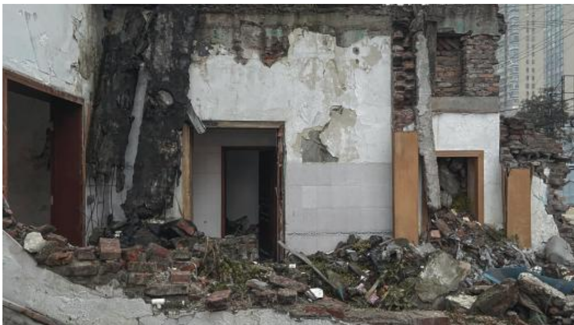
图2 废墟外部，依旧可以看到清晰的墙体结构的搁置空间，2023 拍摄于长沙