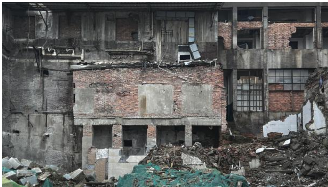
图1 废墟外部，依旧可以看到清晰的墙体结构的搁置空间，2023 拍摄于长沙

这些被长期搁置，仿佛无人关注的建筑群仿佛时间静止一般，往往只完成了一部分拆除：墙体被破坏，室内结构暴露，但整体但外轮廓框架仍然存在。与外部规整的框架形成鲜明对比的，是框架内部堆积如山的瓦砾、碎石、裸露的钢筋和剥落的墙皮。这些由建筑解体所产生的物质碎片，是“混乱”最直接的视觉具象。