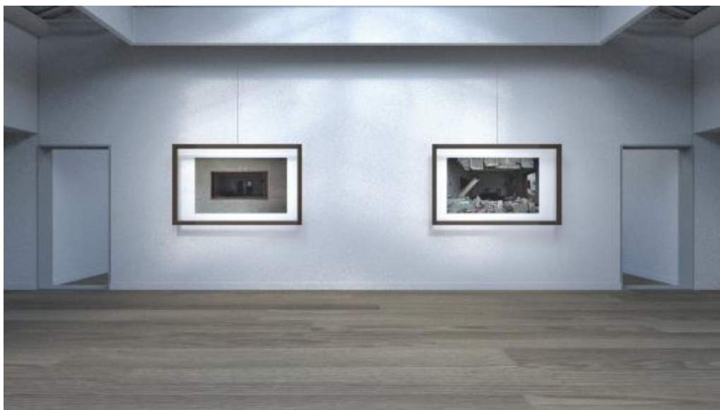
图9 展出示意图，作品与前方的画框分隔而开，画框使用一根鱼线悬吊，2025 年展览

只是通过静态图像，难以完全传达城市“中间态”所蕴含的潜在危机感，因此在构建展出时，为了将作品所捕捉的城市化进程中的现象从二维平面展示延伸至三维空间，达到与观众进行交互的目的，项目进行了展出的装置设计，以“悬置的框架”作为核心语汇，并将“脆弱的平衡”这一概念通过悬吊的渔线具象化。