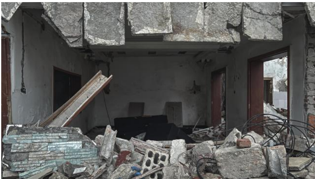
图8 从内部拆除的房屋结构，2023 拍摄于长沙

这种视觉上的对比与冲突，迫使观者思考：在城市化的高歌猛进中，那些曾经的宏伟构想，如何最终走向了物质的解构与无序？这种“悬空停止”的“中间态”景观，正是城市发展未知性的直观体现。通过这种视觉策略，本项目旨在引导观者超越对废墟表象的简单凝视，转而深入探究其背后所蕴含的城市发展困境、社会关系的复杂纠葛以及时间流逝的痕迹。