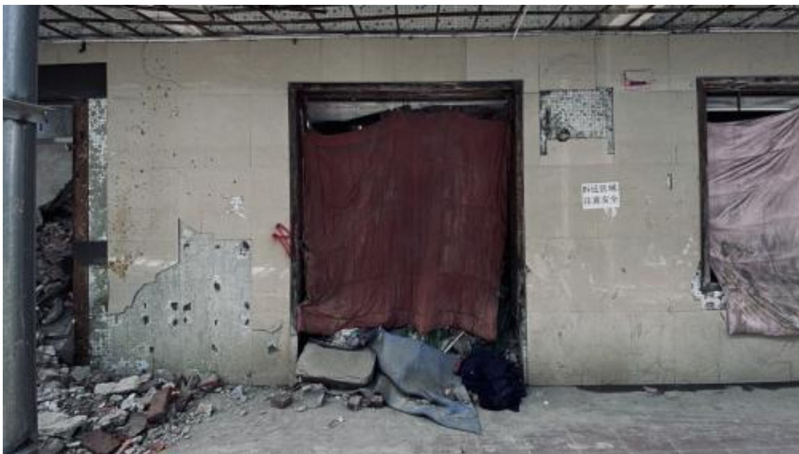
图 6 沿街店铺，可以看出没有被去除的招牌和文字，2025 拍摄于武汉