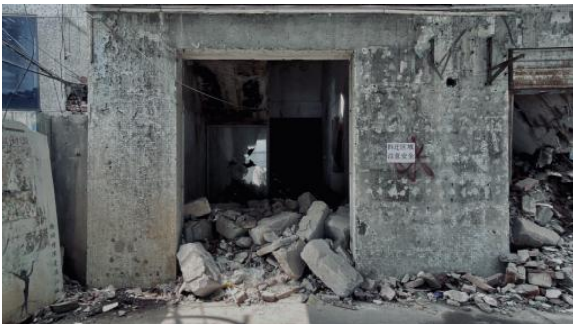
图5 废墟内部，矩形的门窗外框与门框内部杂乱的砖块和生活痕迹，2025 拍摄于武汉

在具体实践过程中，本项目运用了废弃建筑中“方形门框、窗框、墙壁”等规整的结构作为外部构图框架。这些曾经承载着居住、工作等功能，象征着人类理性规划与秩序的几何形体，在画面中构筑了一个个清晰的边界。它们是城市曾经“有序”状态的残余，是规划蓝图的具象化，也是对稳定、可控空间的心理投射 [5] 。