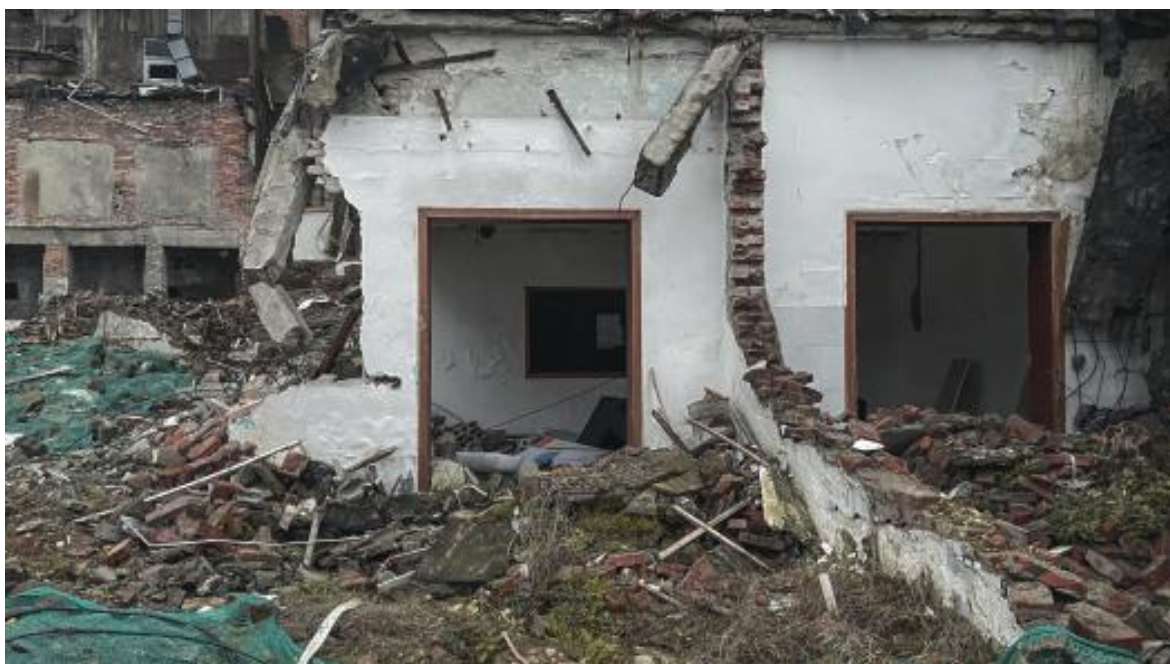
图3 废墟外部，依旧可以看到清晰的墙体结构的搁置空间，2023 拍摄于长沙

另一方面，建筑内部堆积着拆除过程中产生的碎石、砖块与混凝土残骸，而房屋原有的门窗结构仍然保留。曾经属于居住生活的痕迹也仍然残留在这些空间之中，例如破旧家具、墙面装饰或一些被遗弃的私人的生活用品。这类似于美国摄影师 Anthony Hernandez 在其作品中对“无家可归者的风景”（Landscapes for the Homeless）的关注 [4] ，将目光投向废弃建筑中那些看似微不足道，却承载着人类活动痕迹的细节。例如，墙壁上褪色的涂鸦、角落里遗留的旧物、被踩踏的泥土路径，甚至是光线在残破结构上投下的斑驳阴影 [2] 。这些人文印记，是城市曾经鲜活生命力的残余，是“被忽视的事物”的佐证。