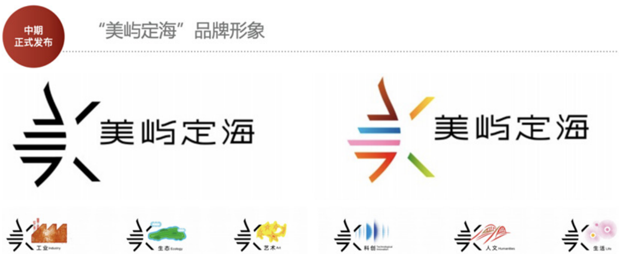
图8 美育品牌形象建立