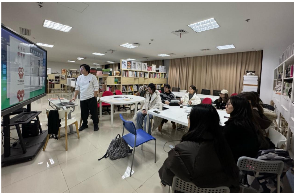
图3 高校美育工作室项目研讨