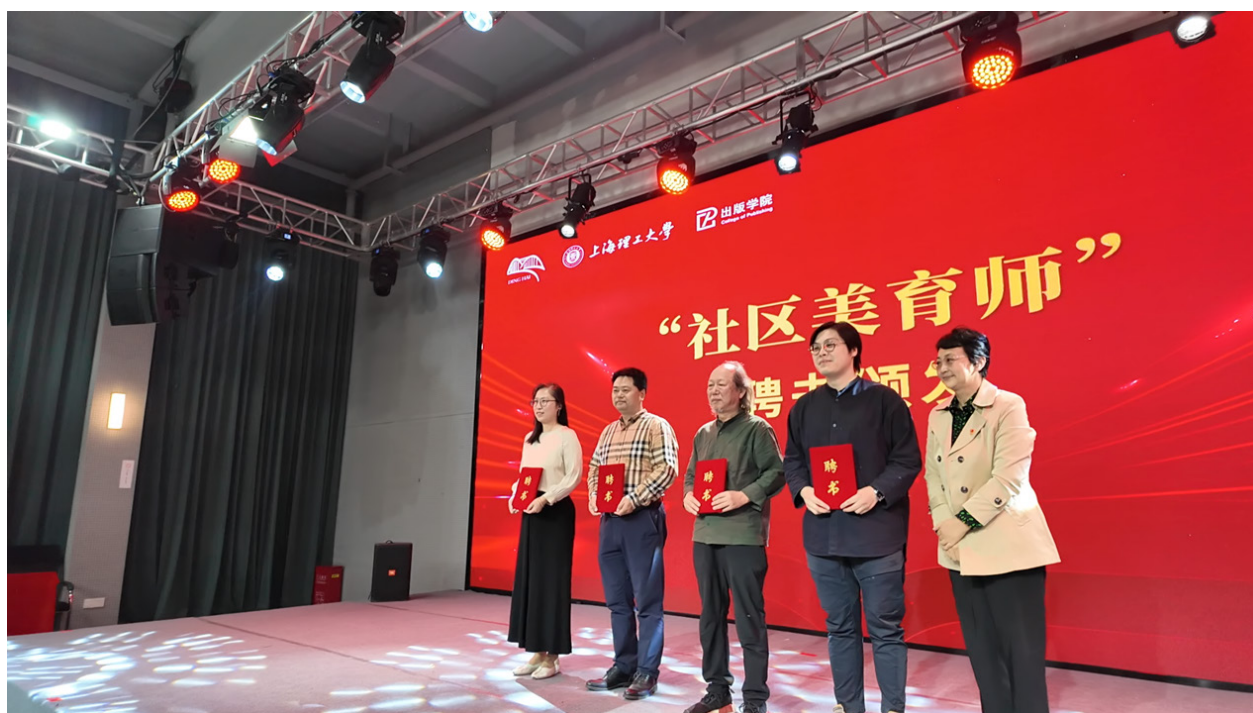
图4 上海理工大学出版学院教师团队受聘“社区美育师”