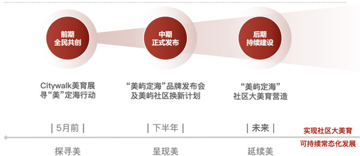
图7 美育品牌实施规划