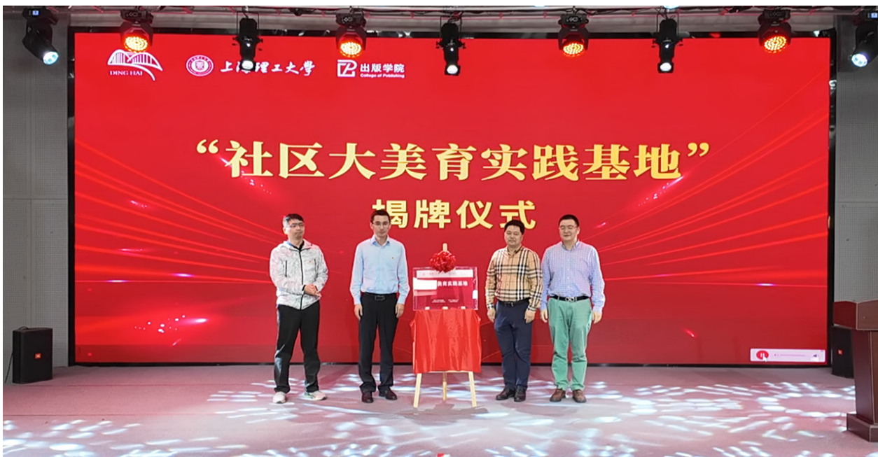
图1 “杨浦区定海路街道 - 上海理工大学出版学院”社区大美育实践基地揭牌