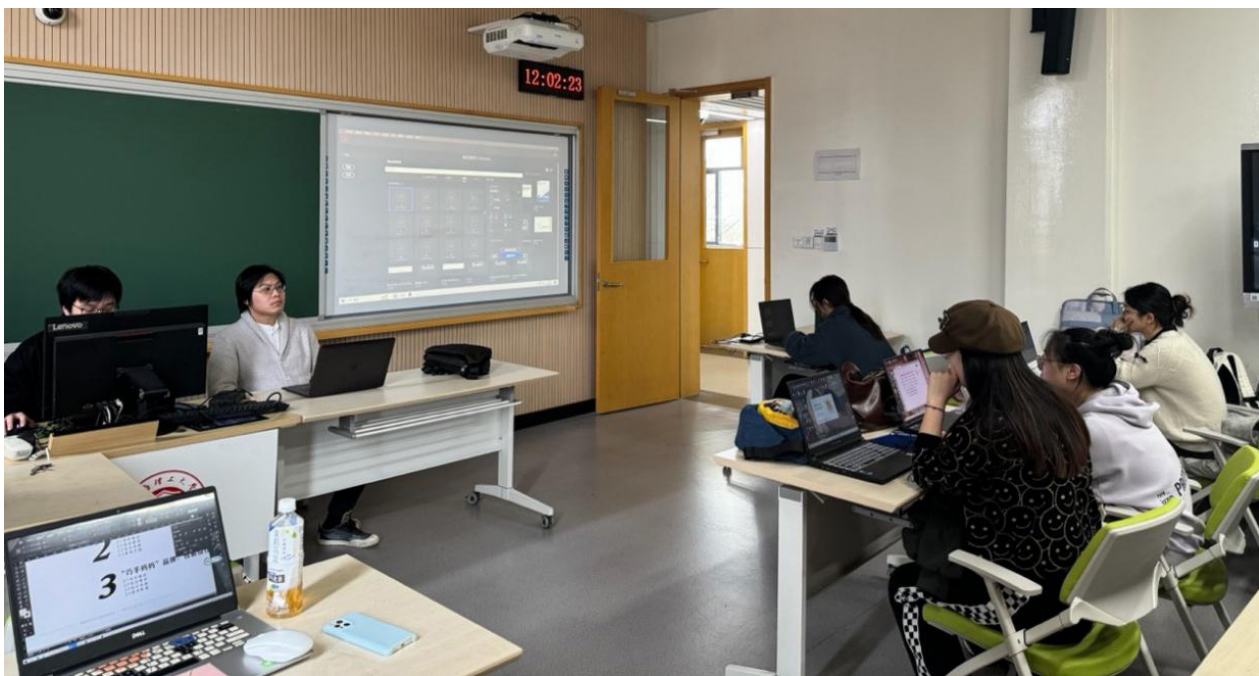
图5 数字美育实践培训