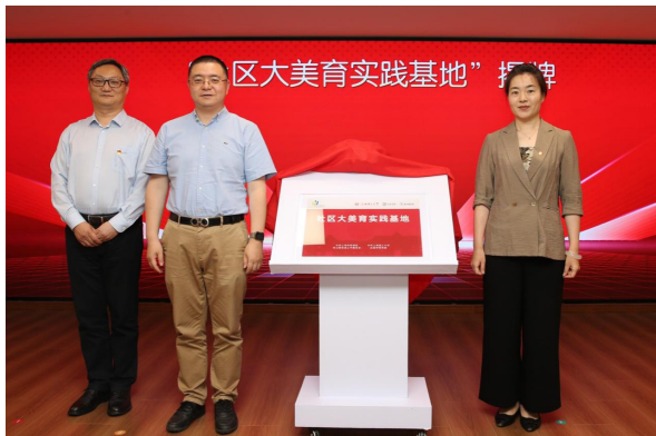
图2 “杨浦区控江路街道 - 上海理工大学出版学院”社区大美育实践基地揭牌