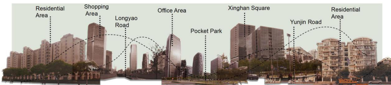
图3 场地周边环境图